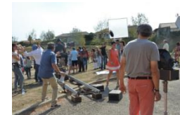
Visite de tournage