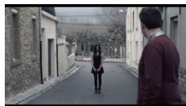
... ou en extérieur