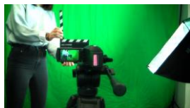
Tournage au lycée